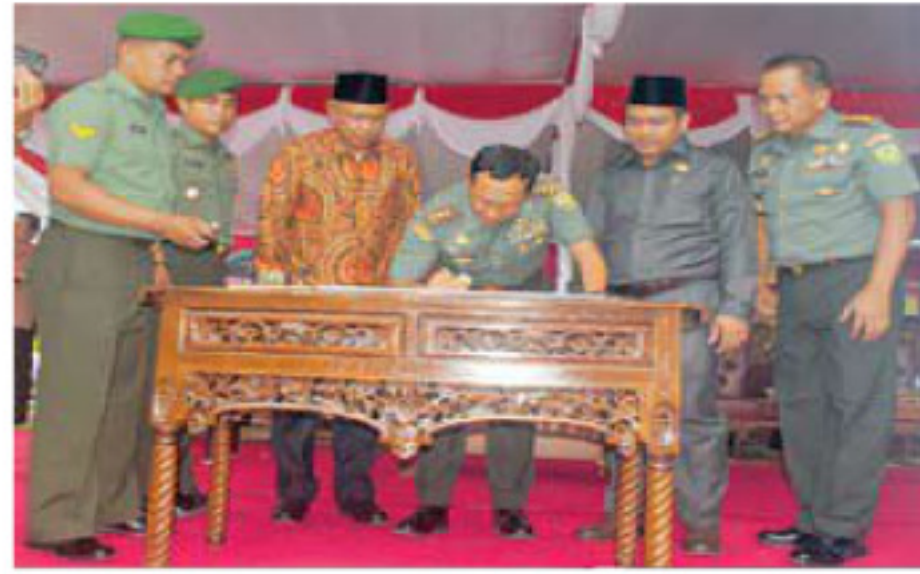
Pangdam saat menandatangani prasasti pembangunan Koramil 406-03 Muara Rupit.