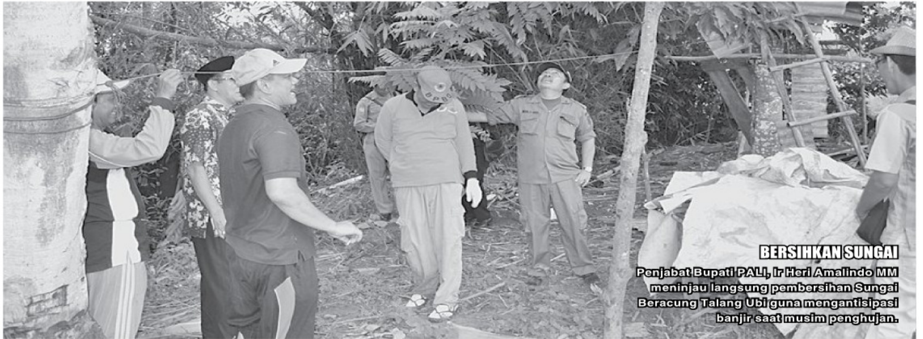
BERSIHKAN SUNGAI Penjabat Bupati PALI, Ir Heri Amalindo MM meninjau langsung pembersihan Sungai Beracung Talang Ubi guna mengantisipasi banjir saat musim penghujan.

"Sebagai kepala daerah sudah sepatutnya memperhatikan kinerja bawahan. Tujuannya supaya masyarakat bawah bisa menikmati kebersihan. Apabila dilingkungan kita bersih, mudah-mudahan terhindar dari penyakit, terutama penyakit demam ber-