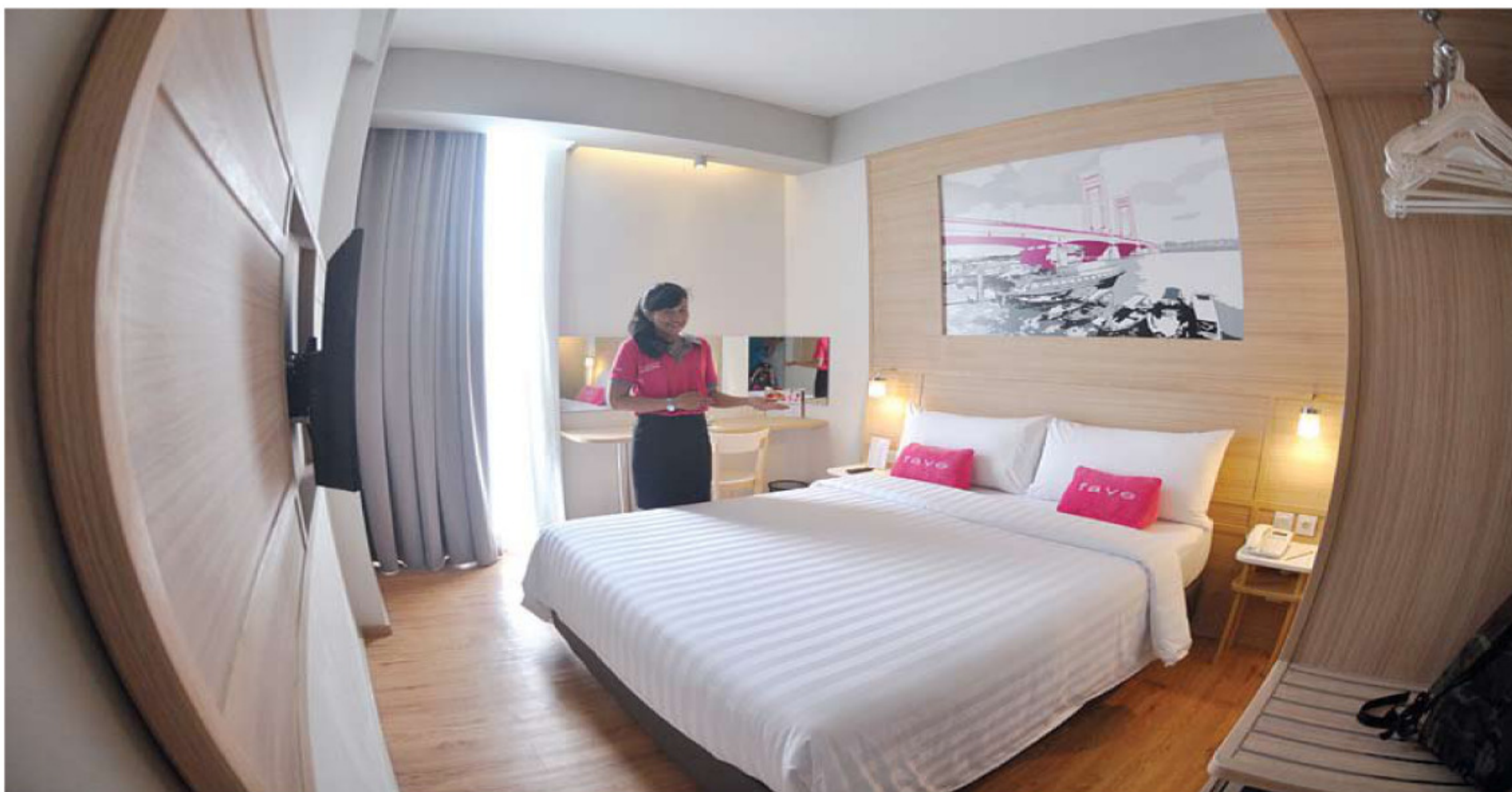
DISKON | Memanjakan pengunjung Fave hotel menghadirkan promo diskon untuk kamar hingga 70 persen.

"Kita berharap dapat menjadi hotel dengan mengutamakan pelayanan dan terus memberikan promo menarik, sehingga tamu akan terus mempercayakan hotel berbintang dua ini sebagai salah satu tempat menginap dengan promo kamar yang murah," tandasnya. ● KUR