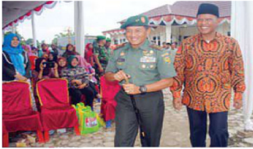
Pangdam dan Pj Bupati disambut hangat saat memasuki halaman Pemkab Muratara.