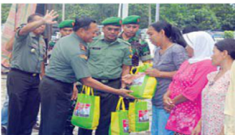
Pangdam memberikan paket sembako kepada masyarakat secara simbolis.

"Memang saat ini belum ada tanda-tanda pembentukan organisasi ISIS di daerah kita, cuma perekrutan saja itu yang harus diwaspadai," singgung Iskandar menegaskan seluruh Camat, Lurah, dan Kades agar mewaspadai perkembangan ISIS ini. ■ IMR/ADV