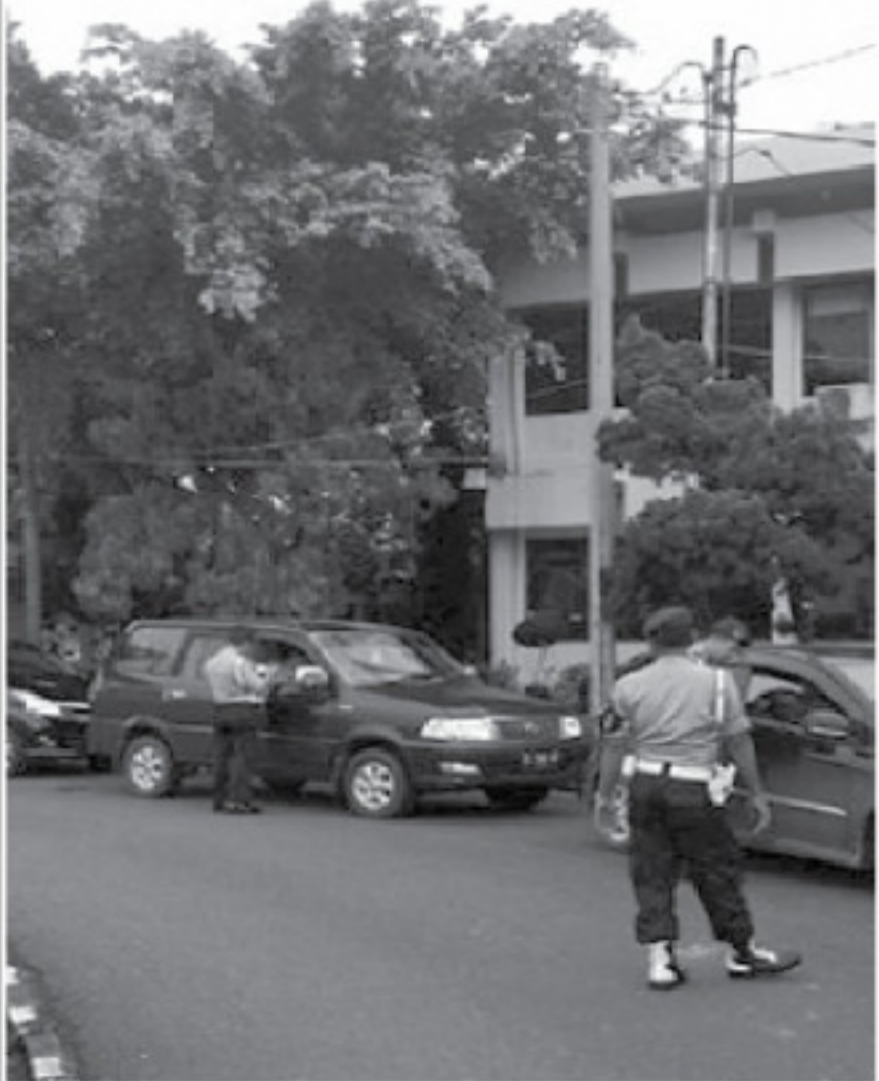
RAZIA Anggota Bid Proram dan Ditlantas Polda Sumsel memeriksa surat-surat kendaraan anggota Polda Sumsel pada razia dadakan, Kamis (9/4).

Menurutnya, operasi digelar mendadak terhadap anggota Polda Sumsel ini merupakan tindak lanjut atas perintah Mabes Polri. Perintah tersebut dikeluarkan Mabes Polri setelah adanya kendaraan dinas yang hilang di halaman parkir Dit Intelkam Mabes Polri. Sebab itu, Mabes Polri mengeluarkan perintah ke seluruh polda di Indonesia untuk mencegah terjadinya hal ini. Terkait penggunaan kendaraan yang dijadikan barang bukti, Rantau mengatakan, anggota hanya diperbolehkan menggunakannya untuk kepentingan penyelidikan suatu kasus. “Operasi seperti ini kita upayakan untuk berlanjut,” pungkasnya. ● PTR