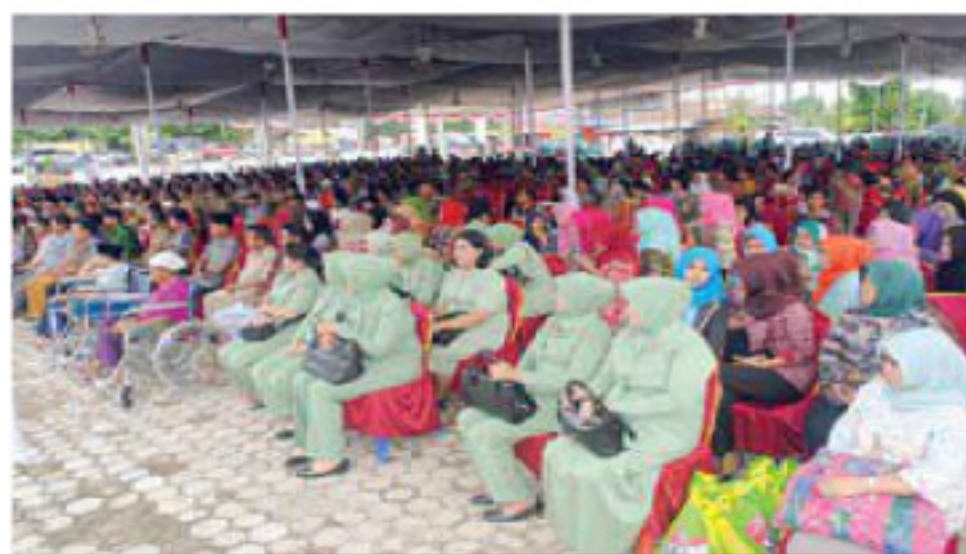
Para pengurus Persit, TP PKK dan warga antusias menyambut kedatangan Pangdam.