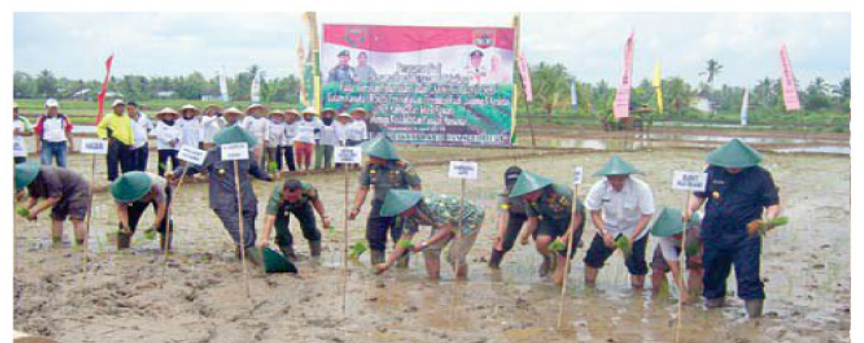
Pangdam didampingi Danrem dan Bupati tengah melakukan proses menanam padi.

Dijelaskan Tohirin, 18 unit bantuan hand tractor itu merupakan bagian dari alokasi alsinta tahun 2015 Kabupaten Mura dengan sumber dana dari APBN yang terdiri dari pompa air 41 unit, Traktor roda 2 sebanyak 135 unit, traktor roda 4 sebanyak 6 unit dan 18 unit Rice Transplanter. ■ ADV/RIF