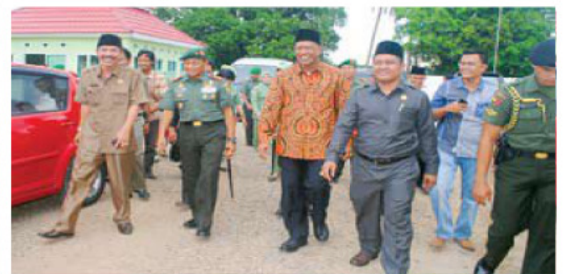
Pangdam didampingi Pj Bupati dan Ketua DPRD Muratara usai menyaksikan pengobatan dan sunatan massal.