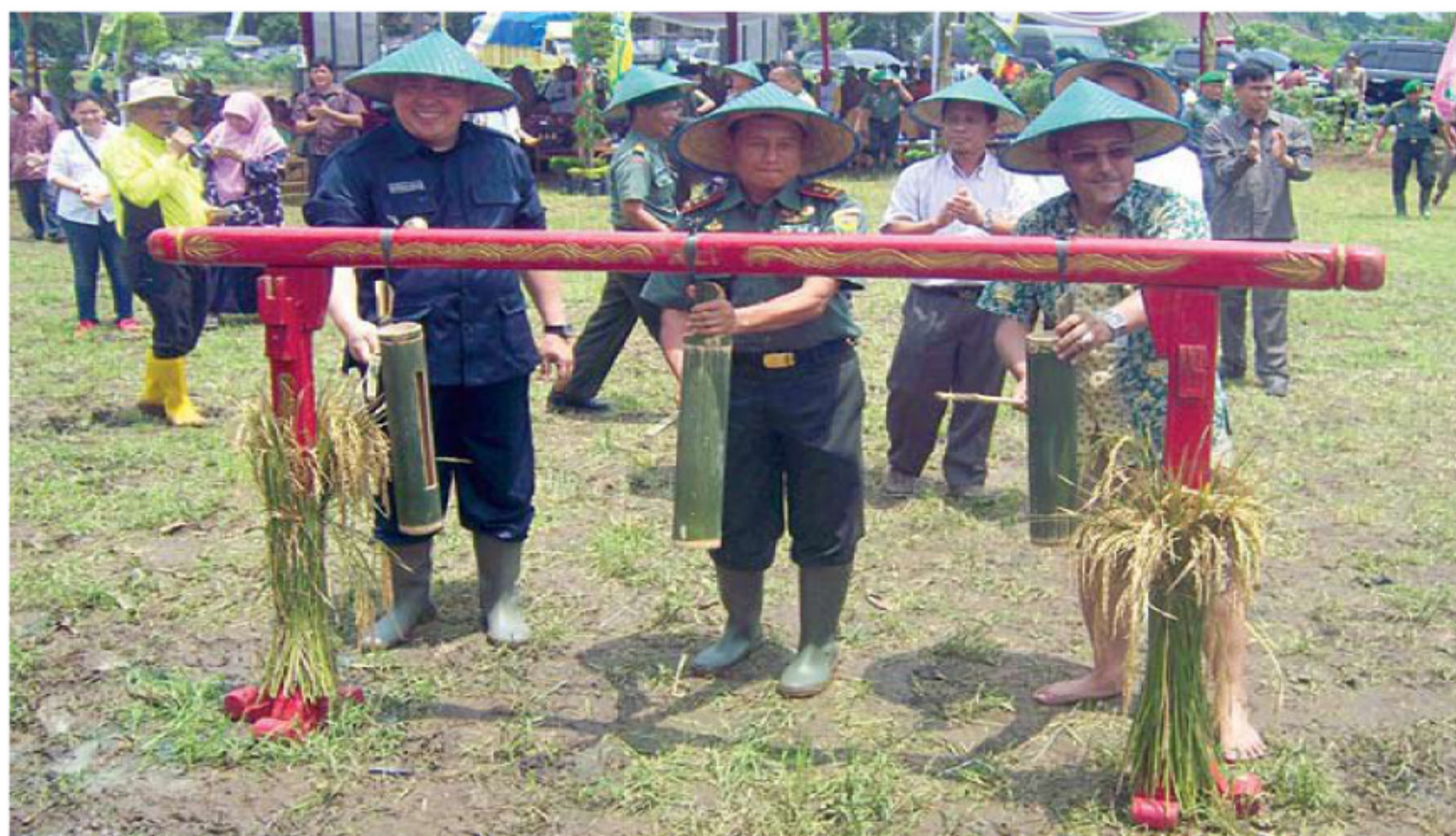
Pangdam dan Bupati melakukan pemukulan gong tanda dimulainya proses penanaman padi.