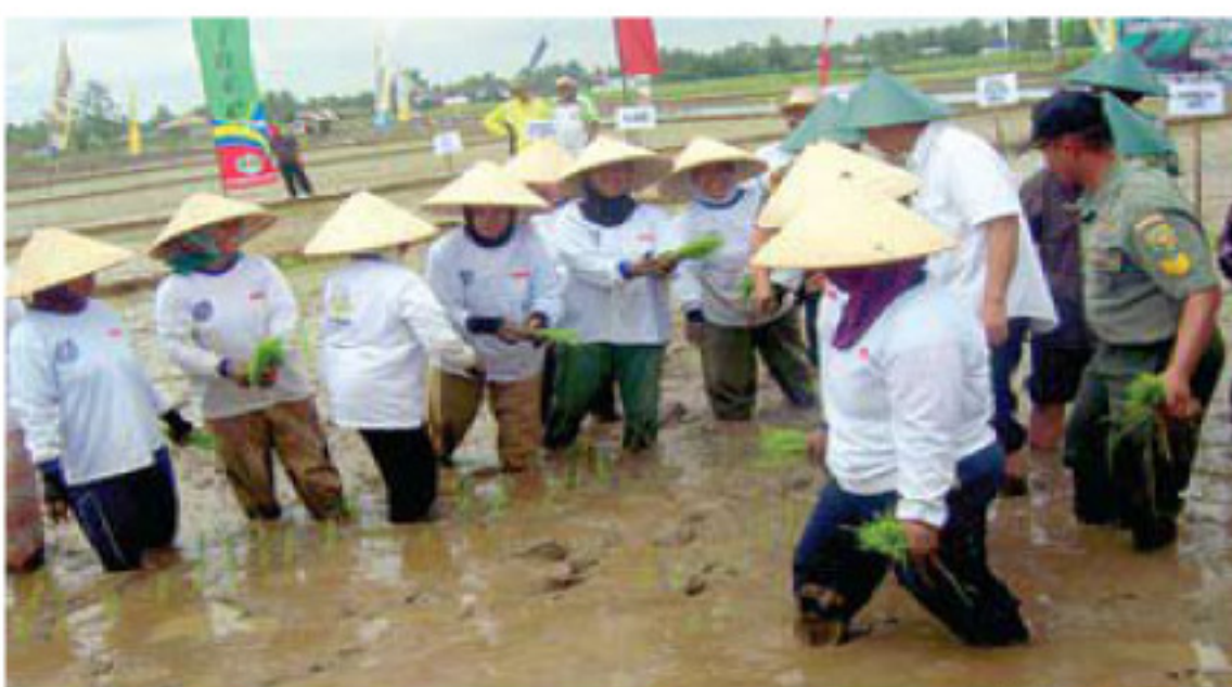
Warga Desa D Tegalrejo, Tugumulyo ikut bersama Pangdam, Bupati dan rombongan menanam padi.