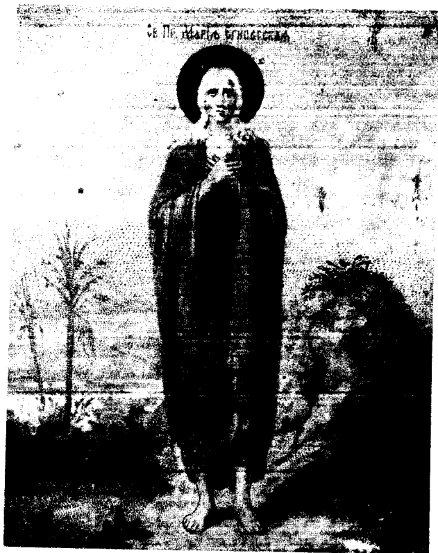
القديسة مريم المصرية الناسكة الثابتة .

من الإسكندرية ، حوالي القرن الخامس ، تقبّلت توبتها الأولى داخل كنيسة القيامة ، فانطلقت وحيدة ، وعاشت في بادية الشام ، شرق الأردن ، وقضت بقية أيام حياتها ( ٤٧ سنة ) في نسك رائع يعجز عن وصفه الخيال ويخور من دونه الرجال .