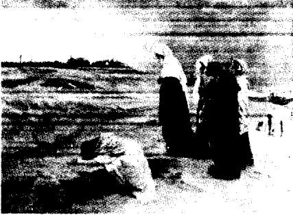
التلاميذ هربوا ، والمرمات وقفن ينظرن الصليب من بعيد .