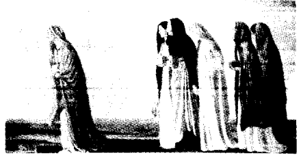
ثم المرمات حاملات الطيب فجر القيامة .

أمانة المرأة التي لا تخور ولا تخاف في أصعب مواقف الخطر، حتى تكمل واجبات العزاء، بروح الأمومة التي تتحدى الموت — لذلك كانت أول من رأى القيامة (مت ٢٧: ٥٥ و ٥٦)، (مر ١٥: ٤٠ و ٤١)، (لو ٢٤: ١٠)، (مر ١٦: ١ و ٢).